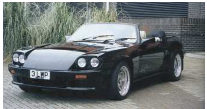
Eléments de carrosserie extra-larges - Lister System III - pour les versions LE MANS Coupé et Cabriolet. A noter : la belle intégration des deux rétro. latéraux, pour le prix de 840£ (on suppose que c'est pour la paire!)