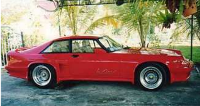
La taille de l'écope pour les freins AR donne une idée de l'élargissement des ailes, à l'arrière