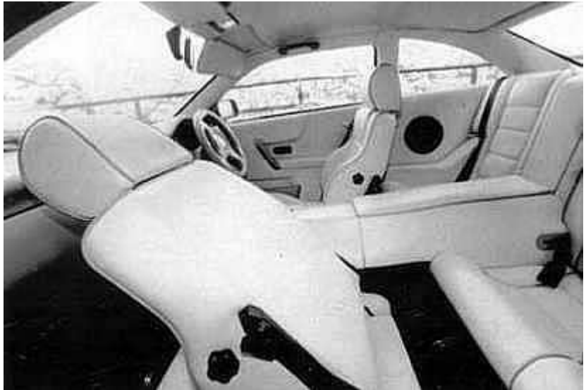
Quatre places nettement séparées par l'énorme tunnel de transmission. Les places arrière sont traitées avec autant de soin que celles de l'avant, mais l'espace est mesuré pour les jambes.