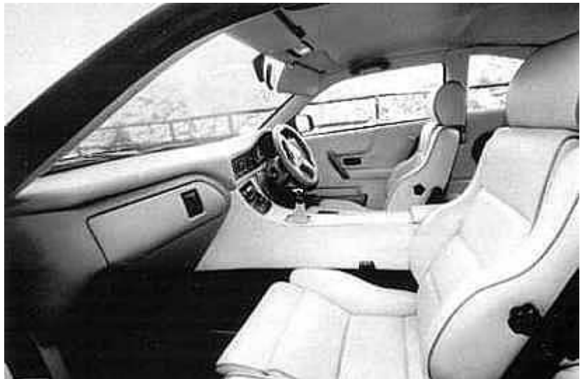
Surprise : l'habitacle est entièrement tendu du meilleur cuir Connolly. Equipement haut de gamme évidemment, mais de nombreuses commandes sont empruntées à la grande série.

Le gros V12 Jaguar est servi par une boîte Getrag, à 6 rapports, identique à celle d'une BMW 850. Renforcée pour faire face au couple surabondant, elle est très dure à manipuler.