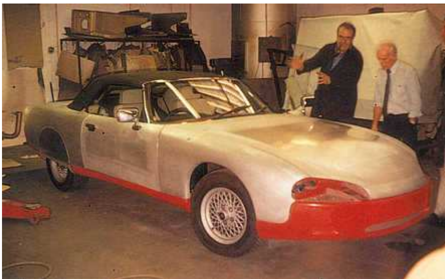
La voiture avec ses éléments de carrosserie en cours de préparation et de montage.